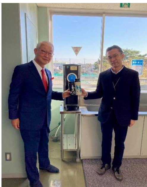
オリジナルマイボトルを手に記念撮影

PTAでは今後とも、子どもたちのより良い環境整備に寄与してまいりたいと存じます。引き続き、PTA活動へのご理解とご協力をよろしくお願い申し上げます。