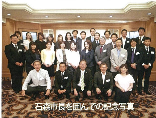
石森市長を囲んでの記念写真