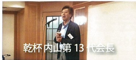
乾杯内山第13代会長