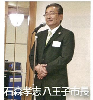
石森孝志八王子市長