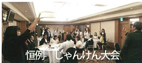
恒例じゃんけん大会